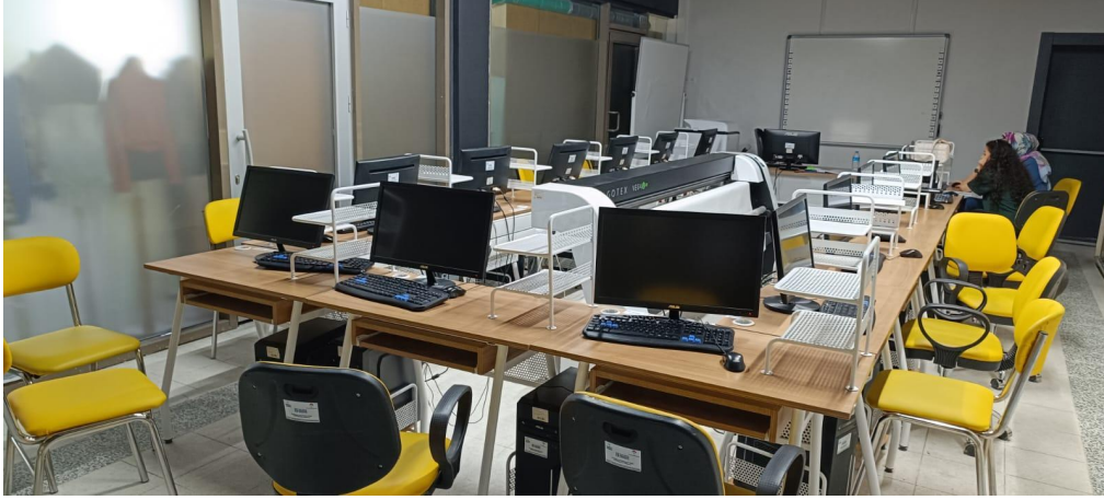
Bilgisayarlı Kalıp ve Tasarım Atölyesi