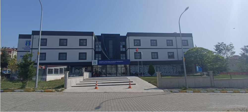
Şekil 1: Ferizli Meslek Yüksekokulu Binası

Moda Tasarımı eğitimi alan öğrenciler, yaratıcılık, estetik, teknoloji kullanımı ve işlevsel üretim ilkeleri ile aldıkları eğitim öğretimle birlikte tasarım sürecini, gerek uygulama ve gerekse yaratıcılık yönüyle özümseyerek üretime dönüştürebilecek nitelikte yetişmektedir.