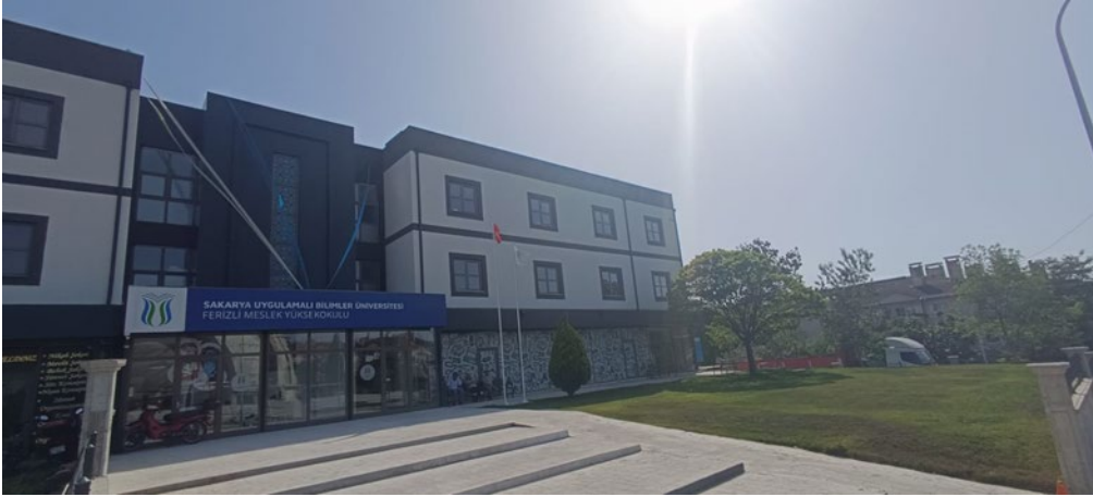
Fotoğraf 2: MYO Yerleşkemiz-2